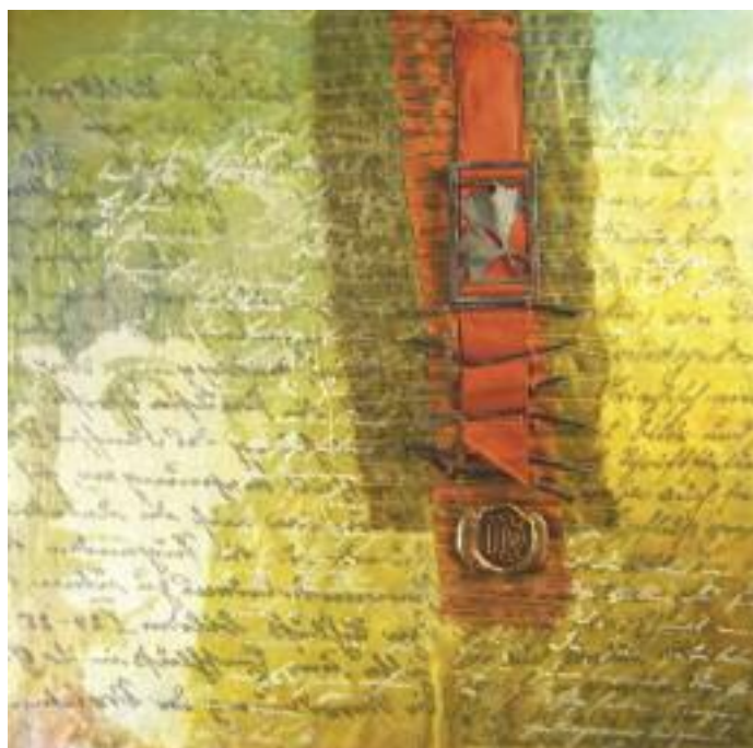
Schriftwechsel, 2012 (L'ABC de l'art quilt)

Après avoir pratiqué le patchwork traditionnel pendant plus de vingt ans, elle découvre l'art textile au début du vingt-et-unième siècle et depuis ne cesse de travailler et de se perfectionner.