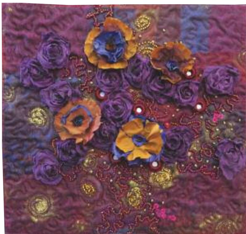
Lollipop flowers , 2013

www.juliette-eckel.com http://www.quilters-insel.de