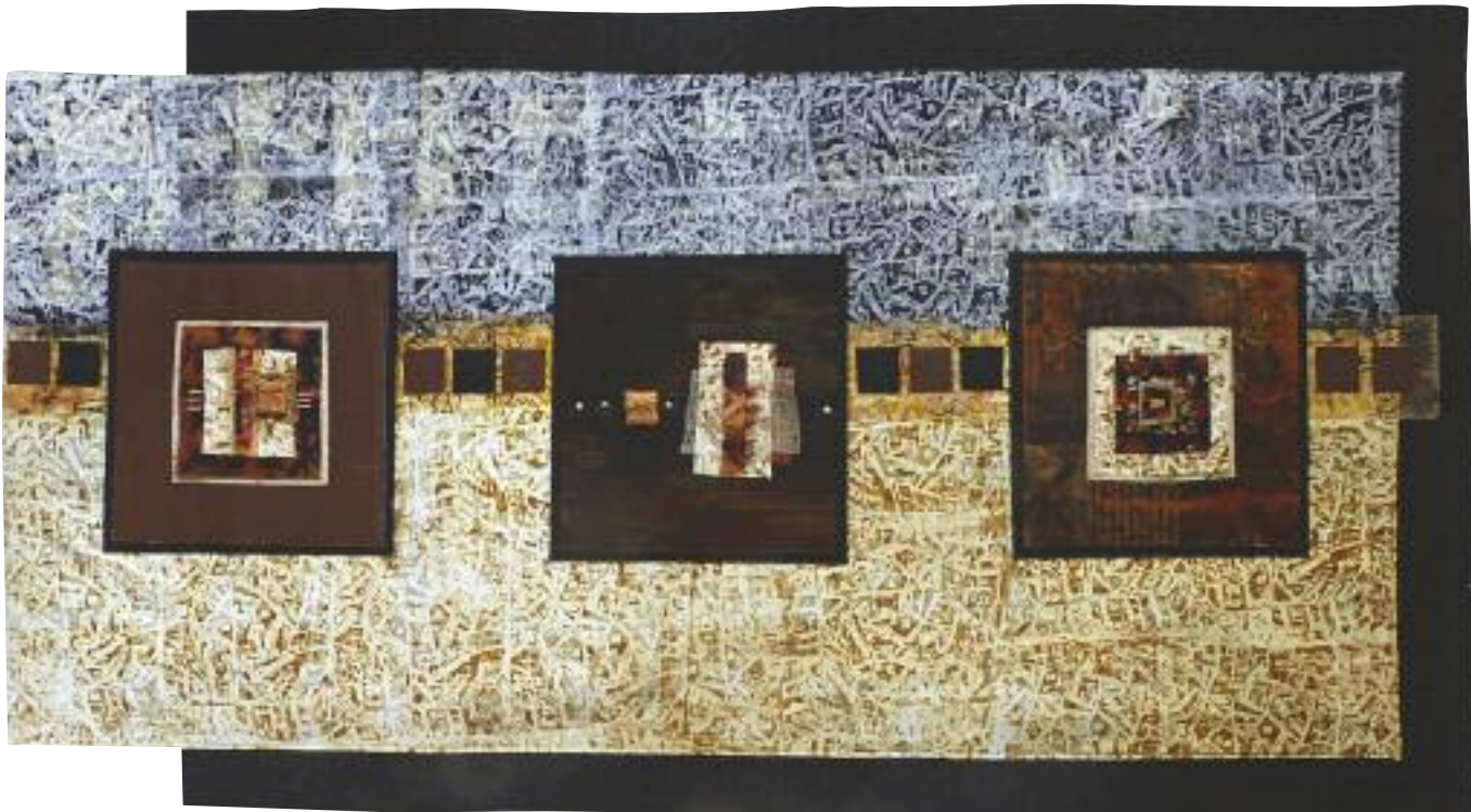
Nichts ist so wie es scheint I , 2014